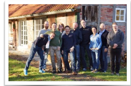
Business Master Gruppe 2016

Für alle, die schon NLP Practitioner sind und... ... Unternehmer/Freiberufler, ... Führungskraft, ... Projektleiter, ... Vertriebsprofi, ... Trainer und Coach, ... BeraterInnen in einem sozialen Berufen, ... an lösungsorientierter Kommunikation interessiert sind.