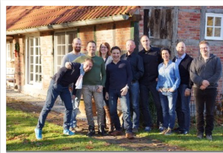
Business Master 2016