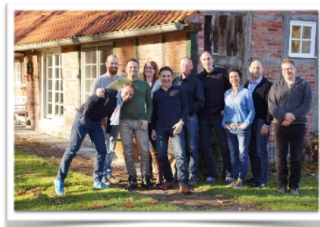
Business Master 2016