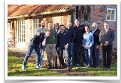
Business Master Gruppe 2016