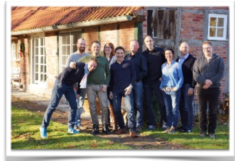
Business Master 2016