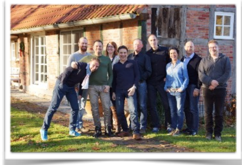
Business Master 2016